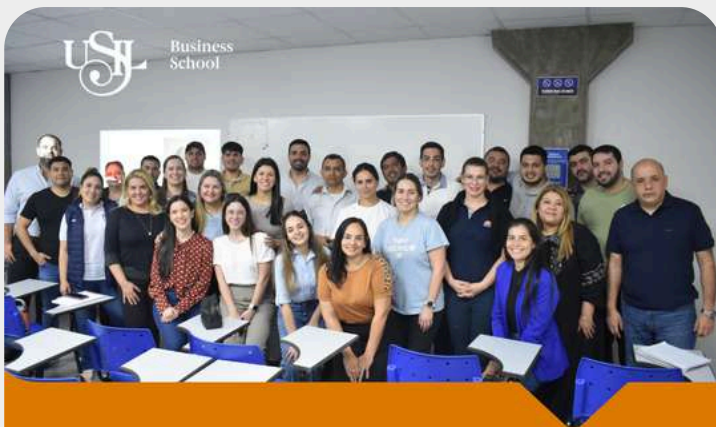
Inicio del Diplomado en Negociación y Resolución de Conflictos