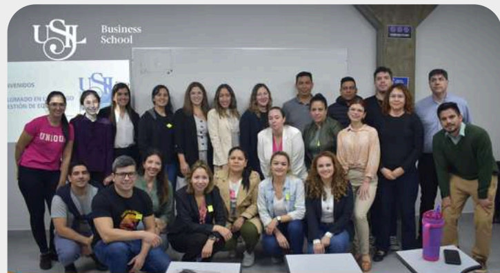
Inicio del Diplomado en Liderazgo y Gestión de Equipos