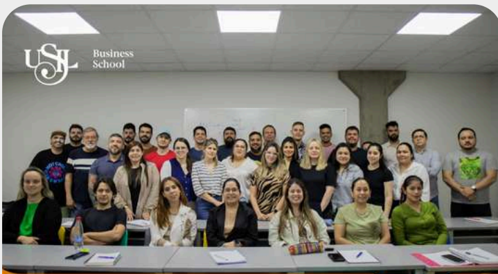
Inicio del Diplomado en Negocios Gastronómicos