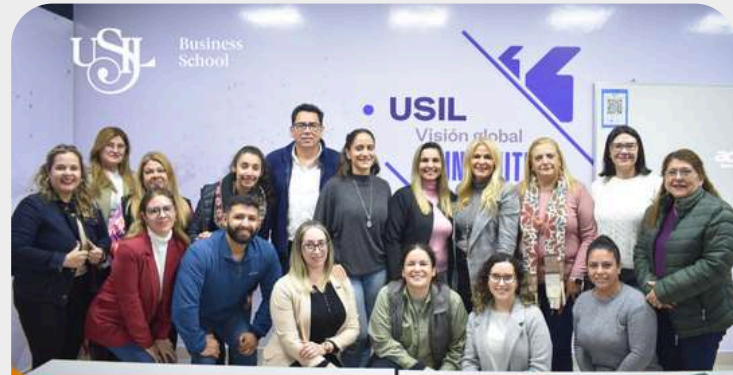
Inicio del Diplomado en Coaching Empresarial